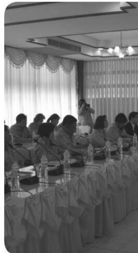
คณะผู้ตรวจการฯ ลงพื้นที่ตรวจราชการตามนโยบายกระทรวงศึกษาธิการ รอบที่ ๑ ประจำปีงบประมาณ ๒๕๖๐ ในพื้นที่จังหวัดตราด